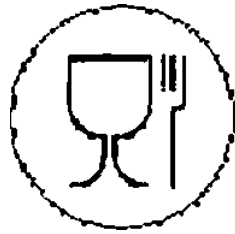
Рисунок А.1—Для пищевых продуктов

А.3 Символ и знаки, наносимые на изделия или упаковочный ярлык, или упаковочный лист (вкладыш), или сопроводительную документацию, характеризующие изделия по назначению: рисунки А.1 и А.2.